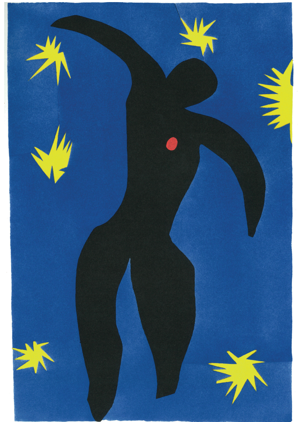
Ícaro, ilustración n.º VIII de Jazz (1947) > Icarus , plate VIII from Jazz (1947) Musée Fabre, Montpellier Méditerranée Métropole

To illustrate Davillier's book about Spain – published in Paris in 1874 by Librairie Hachette et Cie. – Gustave Doré made 309 engravings on wood. These images were published.